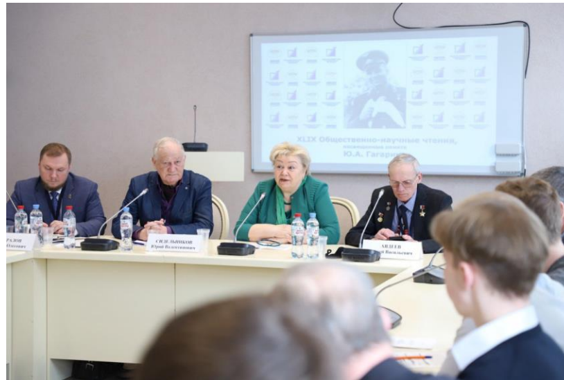
Открытие заседания Чтений. Пленарное заседание

выступление с секционным докладом – до 15 минут